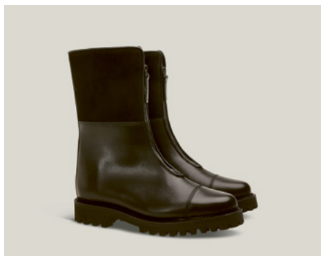
APRÈS SKI BOOT

Wenn Sie also Après-Ski der Warteschlange am Lift vorziehen, haben Sie jetzt die perfekte Ausrede.