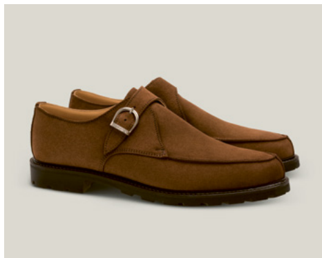
CAMALDULENSER Hydrovelours, Kastanie R.58-VWK.RF-2Z-GJ

An seinen Füßen: der Norweger in Scotch Grain. Handgefertigt, langlebig und nach denselben Prinzipien hergestellt, die auch das Land um ihn herum prägen – Qualität vor Quantität, Tradition vor Trend und Zeit als wichtigstes Maß der Dinge.