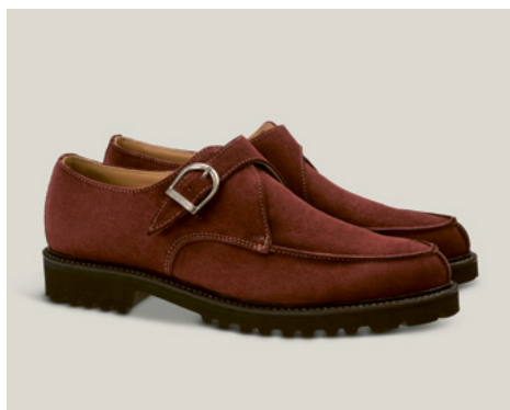
CAMALDULENSER Velours, Herbstrot R.58-VRW.DB-2Z-ES