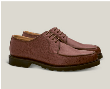
NORWEGER Scotch Grain, Mahagony R.18-SGM.RF-2Z-GJ