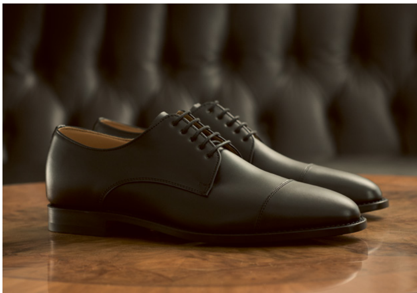
FLORENTINER Boxcalf, Schwarz R.54-BCS.VF-3

Unser neuer Florentiner ist auf dem Victor-Leisten geformt – einer raffinierten, maßgeschneiderten Silhouette, inspiriert von Florenz, der Wiege der italienischen Eleganz. Dort legten die Medici den Grundstein für das moderne Bankwesen, den Handel und die Schneiderei – Disziplinen, die sich der Zeit anpassen, eine Entwicklung, die Bernhard und sein Sohn zu verfolgen und zu schätzen gelernt haben. Denn in Fragen des Stils, ist es wie in der Finanzwelt, die Nachfrage nimmt mit mehr Interessenten zu.