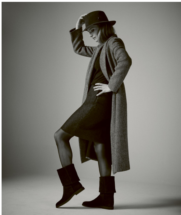
TUNDRA Hydrovelours, Schwarz S.794-VWS.KS

Getragen mit elegantem Rock und wissendem Blick, erweckt der Tundra das Beste des Stils der 60er Jahre – teils Glamour des Kalten Krieges, teils praktische Spionage. Ob Sie nun Botschafts-Cocktailpartys infiltrieren oder einfach nur über die eisigen Wiener Gehwege navigieren, mit diesem Stiefel sind Sie einen Schritt voraus (und gerade warm genug, um zu verweilen).