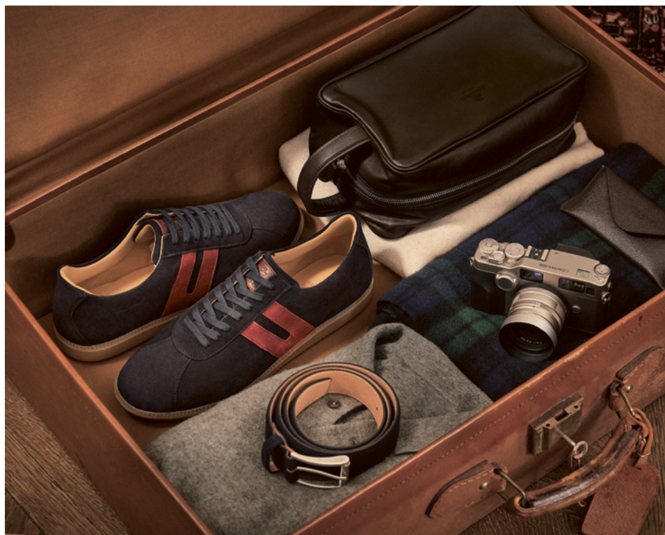
TRAINER Hydrovelours, Navy, Herbstrot T.582-VWN-VRW.T

Weil Motoren gelegentlich ins Stottern kommen, bleibt unser Trainer eine zuverlässige Ergänzung in jedem Koffer. In dieser Saison kehrt unser bester Freizeitbegleiter mit herbstroten Streifen zurück – elegant, anpassungsfähig und bei Bedarf: Ready to push.