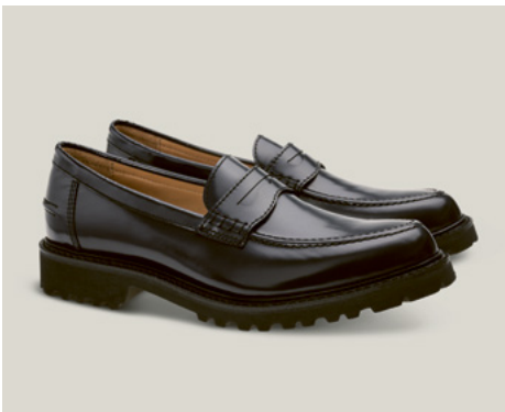
PENNY LOAFER DAMEN Spazzolato Calf, Navy R.41-RCN.DC-2Z-ES