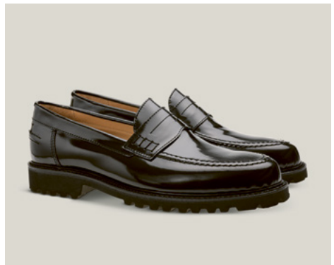
COLLEGE LOAFER HERREN Spazzolato Calf, Onyx R.49-RCS.LN-2Z-ES