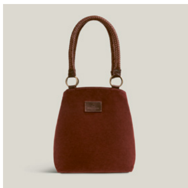
SIESTA BAG Velours, Herbstrot N.T746-VRW