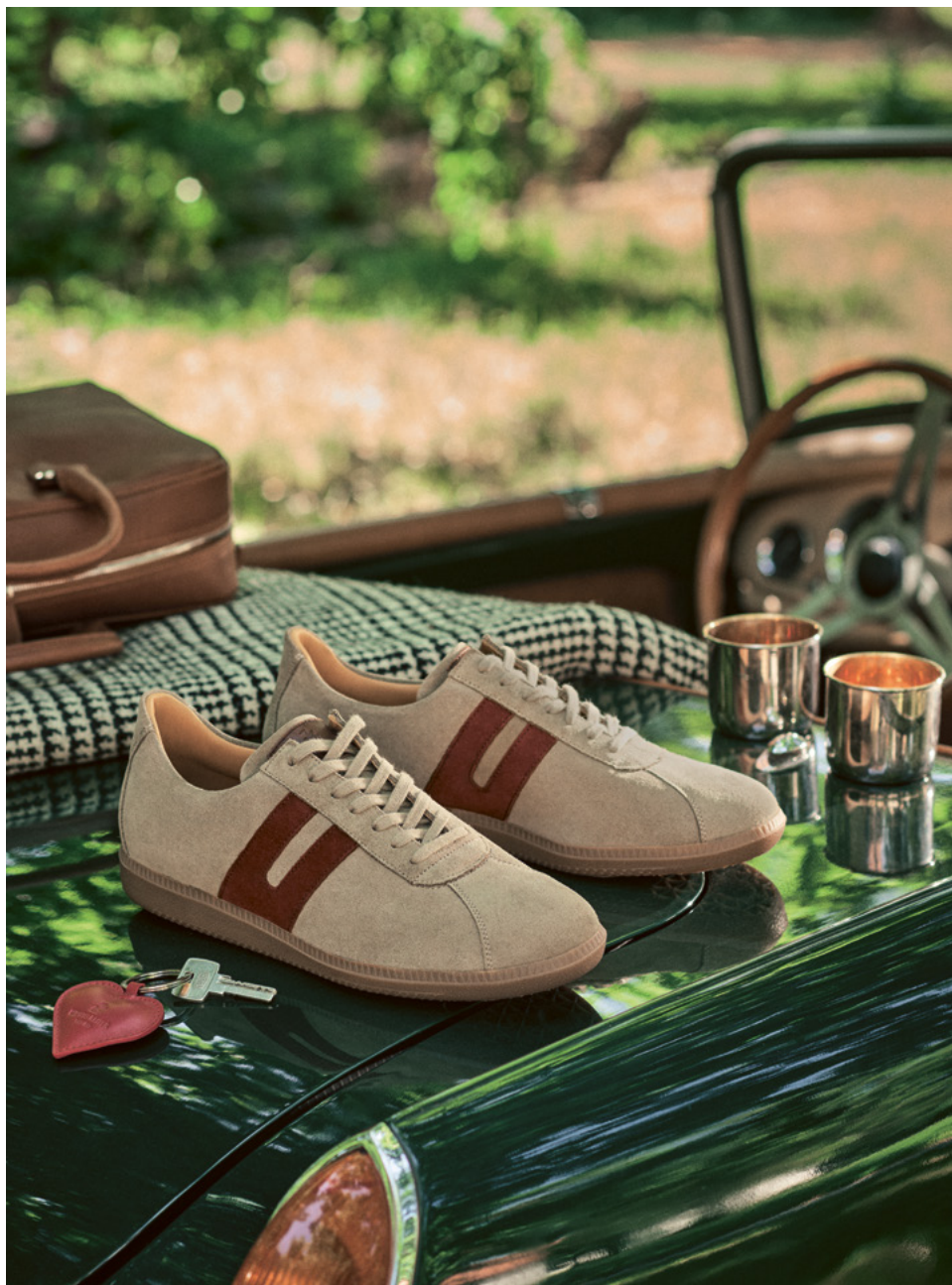
TRAINER Hydrovelours, Taupe, Herbstrot T.582-VWT-VRW.T