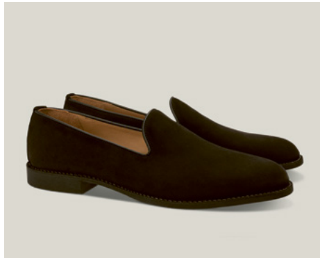
METTERNICH Hydrovelours, Umbra S.40-VWU.TF-7-JS

Manche Gewohnheiten sind es wert, bewahrt zu werden – vor allem diejenigen, die Wärme, Freude und gute Stimmung bringen.