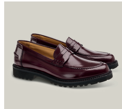
COLLEGE LOAFER Calf Spazzolato Bordeaux Zwieraumen Rahmengenäht S.41-RCW.DC-2Z-ES

Ob zum eleganten Rock oder zum Maßanzug, die Vintage-Kombination aus Socken und Loafers entspricht unserem kulturellen Zeitgeist. Der Look strahlt Selbstvertrauen und Selbstsicherheit aus, welches mindestens genauso glänzt und erinnert an das schicke Italien der Jahrhundertmitte. Es ist eine Verschmelzung von Stil und klassischer Eleganz, bei der sich Tradition und Moderne in den Korridoren der zeitgenössischen Büro-Couture treffen.