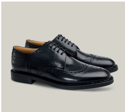
BUDAPESTER Boxcalf Leder, Schwarz, Zwierahmen Rahmengenäht R.16-BCS.OH-2Z-JS