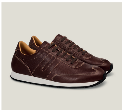
MARATHON Limited Edition Sportcalf, Kastanie T.523-BFK.S

Der lange Weg von der Ernte bis zur Flasche ist einzigartig in der kulinarischen Welt, wie ein Marathonlauf, dessen Destillate Geduld und Charakter erfordern, um die Strecke zu absolvieren. In dieser Saison haben wir etwas Extrazeit damit verbracht das feinste Sportcalf-Leder für unseren „Marathon“-Trainer zu finden, um unseren Athleten eine raffinierte Note zu verleihen.