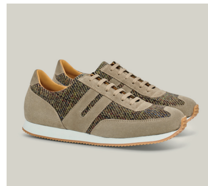
MARATHON Tweed, Velours, Olive Green / Tabak T.523-TWI-VST.C

Tweed, das seinen Ursprung in Schottland hat, ist eines der begehrtesten Wolltextilien der Welt und hat wie Ludwig Reiter eine reiche Tradition, die über 100 Jahre zurückreicht. Wir freuen uns, dass Sie die Früchte dieser Partnerschaft genießen, die Tradition der handwerklichen Waren und Grenzen überschreitende Ideen zu schätzen wissen.