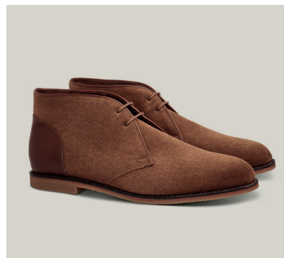
CHUKKA BOOT Rahmengenäht, Hydrovelour Maron / Horseback, Mittelbraun R.6o-VWM-CRM.TGS-2-KC

Unser Chukka-Stiefel, der in einem Zeitalter der kultivierten Freizeit konzipiert wurde, in dem sich Leidenschaften in Kunstformen verwandelten, ist ein Zeugnis dieses Erbes. Mit seiner robusten Fersenkappe aus Leder ist er so konzipiert, dass er selbst den leidenschaftlichsten Unternehmungen standhält und Eleganz und Ausdauer tadellos bewahrt.