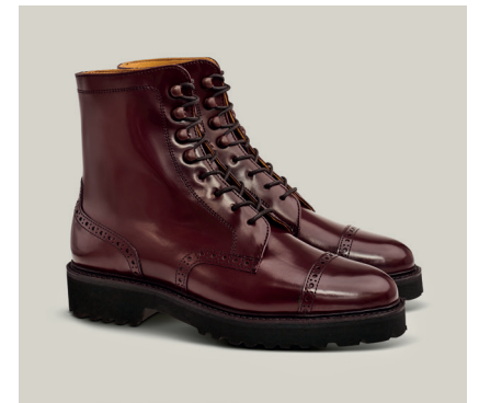
MARY VETSERÄ Calf Spazzolato Bordeaux, Rahmengenäht S.88-RCW.DWF-2-DS