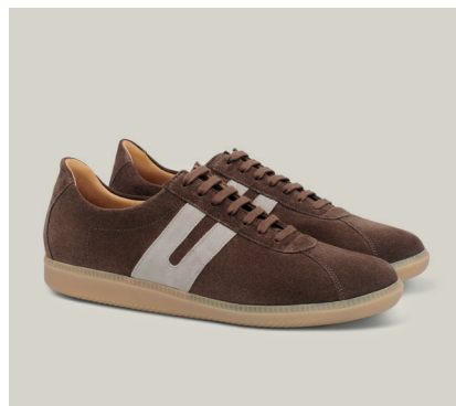
TRAINER Velours, Safari / Quarz T.512-VLJ-VTQ.C