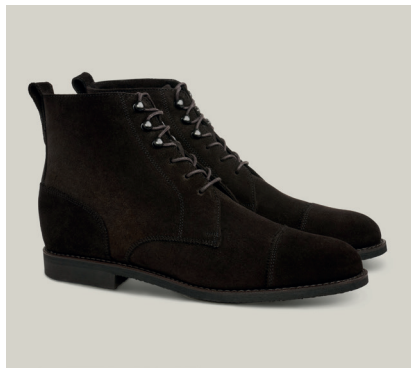
JAGDSTIEFELETTE Rahmengenäht, Hydrovelours, Umbra Dunkelbraun R 74-VWU.TGS-2-KS

Am Flügel des Österreichischen Kulturforums London sitzend, tanzten Ibrahims Finger anmutig über die Tasten, seine Schuhe wurden eins mit den Messingpedalen und verwoben Einfachheit und Komplexität zu einem Klangteppich. Musik ist seit langem der treue Begleiter von Ludwig Reiter, einer Marke, die seit ihrer Gründung im Jahr 1885 für unvergleichliche Handwerkskunst und zeitloses Design steht. Der Philosophie von aufwändiger Handarbeit und edlem Design folgend, bleiben unsere Kreationen der ursprünglichen künstlerischen Partitur treu.