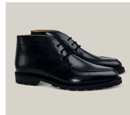
GRÖBMINGER Vintage Pullup, Schwarz, Toskaner Last R.69-RPS.TGS-zZ-GJ

Unser rahmengenähter Gröbminger aus Vintage Pullup Leder mit seiner allwettertauglichen Sohle ist eine Hommage an dieses Ensemble – ein Tanz aus Zweckmäßigkeit und Raffinesse, bei dem sich Form und Funktion wie in einem zeitlosen Ballett vereinen.