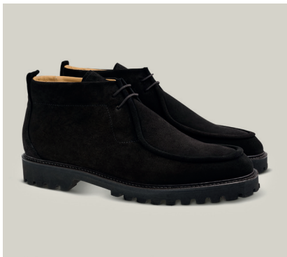
TOURING Hydrovelours, Umbra, Zwierahmen Rahmengenäht S.228-VWU.OH-ES

Für einen Architekten, der lange Tage bei Baustellenbesichtigungen, Kundenbesprechungen und Vorträgen verbringt, bietet der „Oscar“-Leisten unseres zeitlosen Touring Modells den nötigen Komfort. So entspannt lassen sich tiefgründige Gedanken fassen.