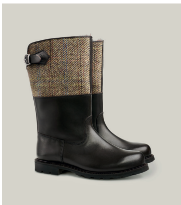
MARONIBRATER Juchtenleder / Tweed, Mocca / Grau, Rahmengenäht S.592-D-TWI

Dieser britische Maronibrater ist am Schaft mit feinem englischen Tweed versehen. Dieses warme und haltbare Detail, verleiht dem Zeitvertreib mit dem pelzigen Freund britischen Charme. Diese Stiefel passen bei Spaziergängen auf dem Land oder bei Erkundungstouren in der winterlichen Stadt und verkörpern die Essenz der britischen Eleganz und Zweckmäßigkeit.