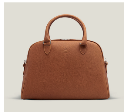
PHILADELPHIA Juchtenleder, Maron N.T601-GPC

Egal, ob Sie auf den Spuren großer Entdecker wandeln oder sich in einer ständig verändernden Welt zurechtfinden wollen, Ludwig Reiter widmet sich der Herstellung von qualitätvollen Produkten, die Ihre Geschichte begleiten.