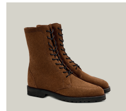
FANNY Hydovelour, Maron, Toskaner Last S 884-VWM.DTR-ES