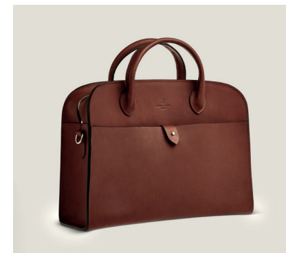
STUDIO BAG Bark-tanned leather, Maron N.T33o-UBM