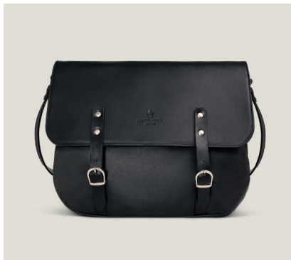
COLPORTAGE Sport Nappa Calf, Saddle Leather, Schwarz N.T601-GPC

Wissen und Verantwortung zu schultern ist Ludwig Reiter vertraut, traditionelles Handwerk und nachhaltiges Handeln stehen an erster Stelle. Unsere Umhängetasche Colportage kombiniert feinstes Sportnappa- und Sattelleder in einer minimalistischen Form. So entsteht ein einzigartig elegantes Modell und ein Zeugnis jener unternehmungslustigen „Reiter“, die Wissen über die Grenzen hinweg transportierten.